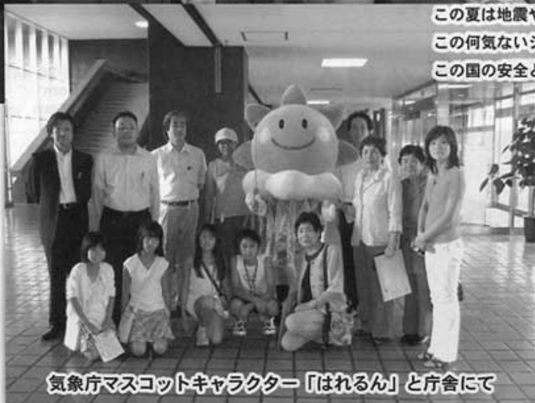
気象庁マスコットキャラクター「はれるん」と庁舎にて

この夏は地震や局地的な大雨・雷雲に見舞われたところも少なくありません。 この何気ないシステムが、私達の安心と安全を作り出していく事になっている この国の安全と安心メカニズムを知ることでできた一日でした。